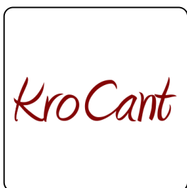
Lieder fürs Herz

Glück kannst du dir nicht kaufen, aber du kannst es pflanzen. www.angelikaertl.at